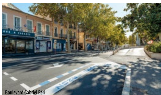
Boulevard Gabriel Péri

Janvier : chemins de Font Clovisse et Saint-Michel.