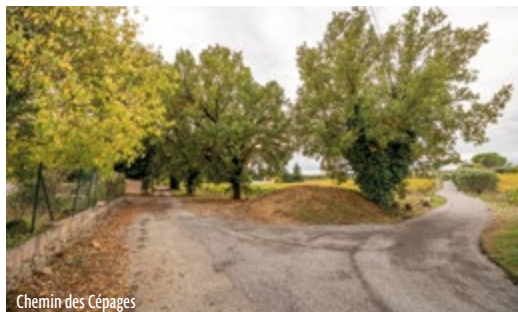
Chemin des Cépages