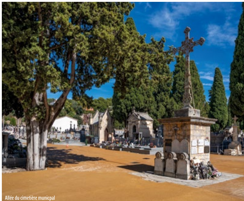
Allée du cimetière municipal

Le choix a été fait de rénover les canalisations de distribution d'eau, et ce, au regard de leur état de vétusté. L'occasion de remettre en eau trois nouvelles fontaines, de reprendre le revêtement clair sur la partie concernée afin de lutter contre les îlots de chaleur, tout en désimperméabilisant le sol. Coût global : 130 000 € TTC.