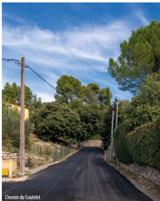
Chemin du Coutelet