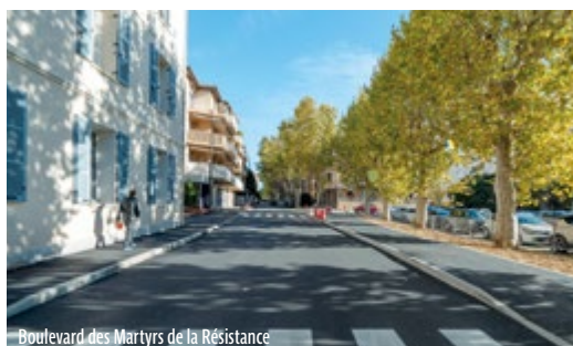
Boulevard des Martyrs de la Résistance