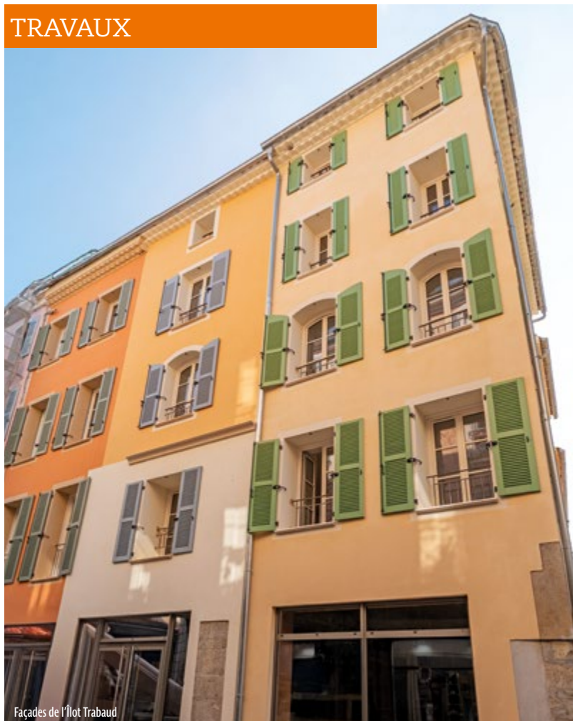
Façades de l'îlot Trabaud